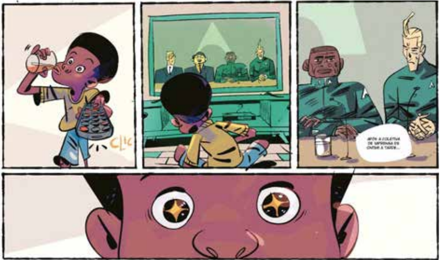
Imagens 14 – 16 – A descoberta de Jeremias de um novo herói, agora de carne e osso.