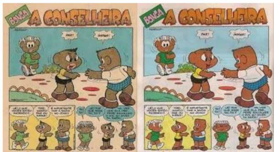
Imagem 2 – A mesma história do Pelezinho publicada em dois momentos distintos