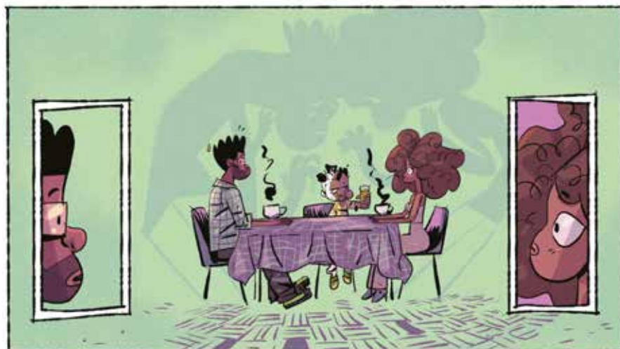
Imagem 18 – O café da manhã com os pais depois da discussão.

errado. Apesar de todo empoderamento dos pais, que têm orgulho do tipo físico, do corte de cabelo, do visual, eles percebem que o menino não aceita bem e está sofrendo com isso. Diante da cena, eles ficam perplexos, mas a sombra mostra o corpo deles curvado, como se estivessem sentindo muita dor e um peso grande sobre eles. Se na cena principal eles estão sentados eretos e afastados pela distância da mesa, na sombra eles estão com as cabeças se tocando.